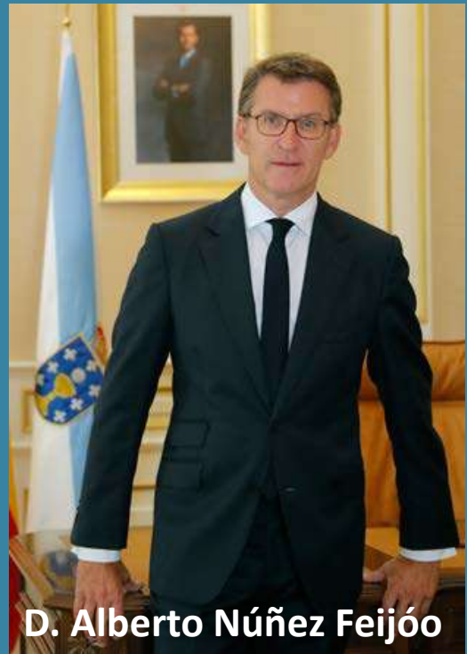
D. Alberto Núñez Feijóo