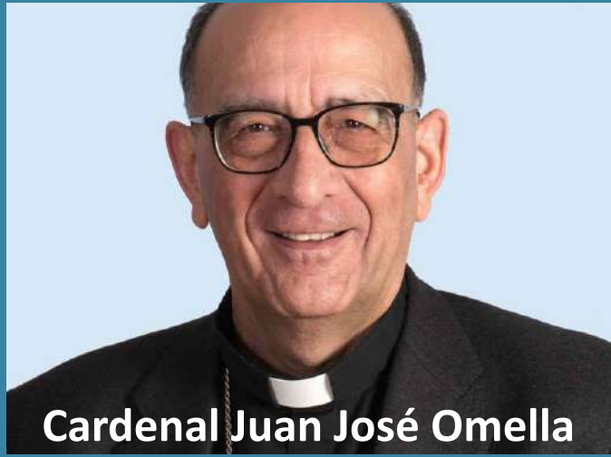
Cardenal Juan José Omella